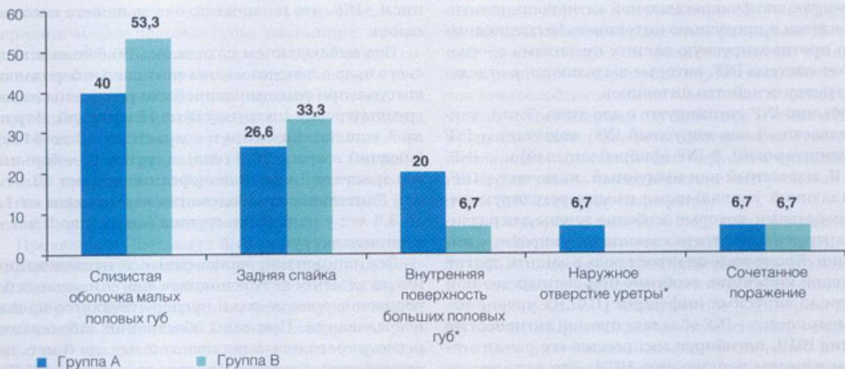
Рис. 1. Локализация аногенитальных бородавок у пациенток исследуемых групп (* p < 0,05 )